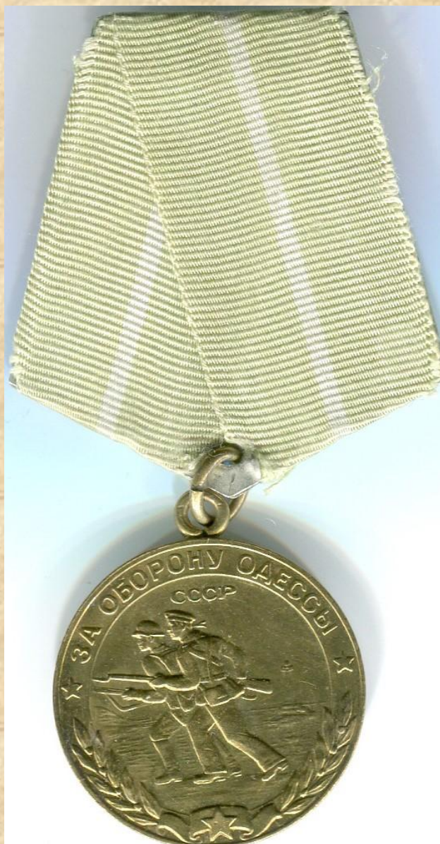
Medal „Za obronę Odessy”